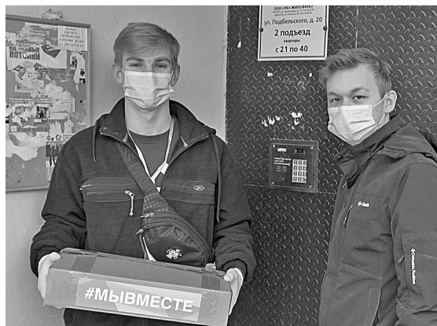
Волонтеры доставляют очередную бесплатную коробку с продуктами