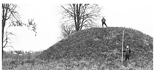
Одна из сопки в районе посёлка Волгино