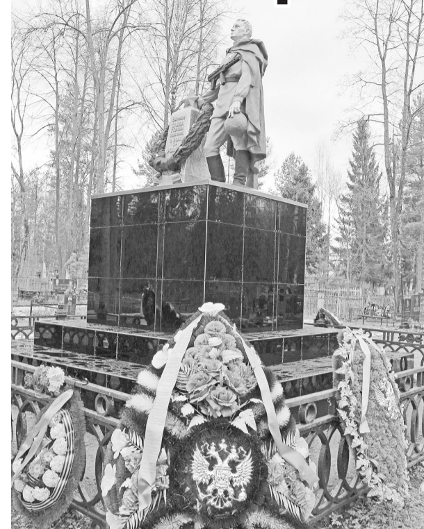
Выполнен ремонт мемориалов и братских воинских захоронений на межпоселенческом кладбище.

К празднику Великой Победы памятники бойцам Красной Армии, установленные на межпоселенческом кладбище (микрорайон ул. Сушанской), посвежели и приобрели более парадный, торжественный вид.