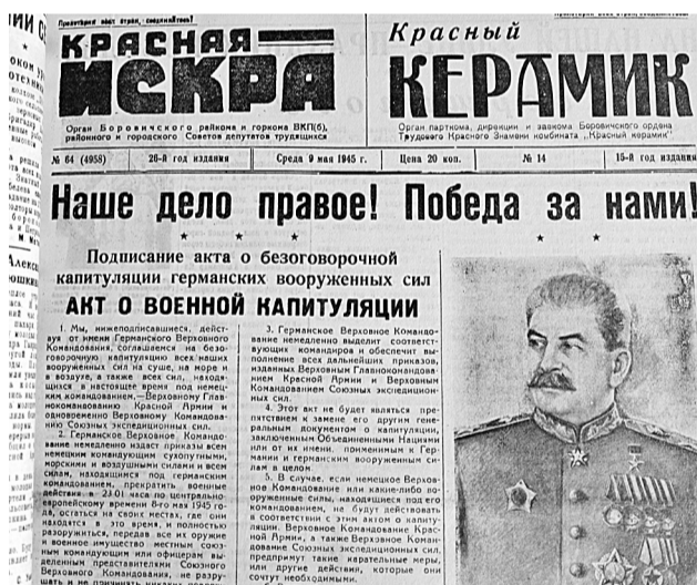
веселящийся город — в те минуты, когда по радио раздались задушевные, простые слова товарища Сталина...» (из статьи Василия Агеева «КИ» от 11 мая 1945 года). Подготовил Константин ЯКОВЛЕВ.

К площади 1 Мая шли старые и молодые, шли тысячи тех, чьими руками здесь, в тылу, приближалась победа!.. До поздней ночи продолжался ликующий праздник победы. В клубах, домах, на улицах гремела музыка, лились русские песни... Лишь на некоторое время притих