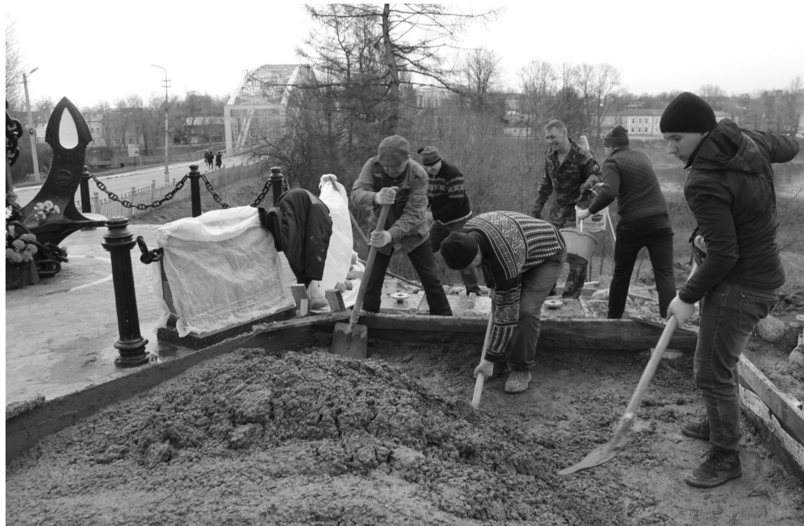
Идёт подготовка к установке обелиска «Боровичанам-флотоводцам»