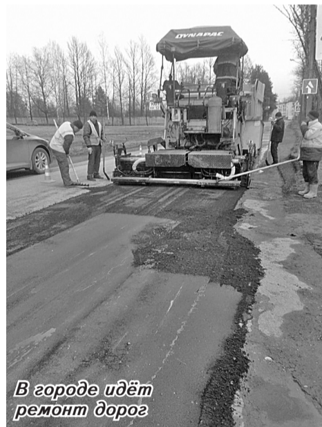
В городе идёт ремонт дорог

Также дополнительно проводятся торги по ремонту дорог в рамках областной субсидии в 50 миллионов рублей.